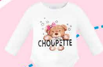
59.92 Боди с длинным рукавом