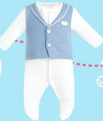
1010.43 Комплект (комбинезон, чепчик)