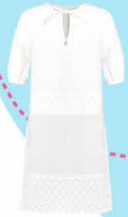
96.1.43 Крестильная сорочка