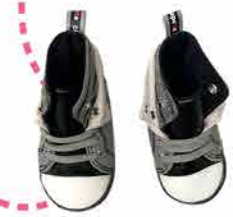
Пинетки в ассортименте