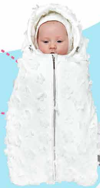
1056.1.43 Конверт на выписку