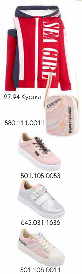
27.94 Куртка 580.111.0011 501.105.0053 645.031.1636 501.106.0011