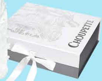
19.265 Коробка подарочная

Где же вы были раньше? - спросила я, когда узнала, что у Choupette появилась такая крутая услуга. Вы не представляете как BABY SHOWER упростит вашу жизнь и сделает подарки действительно желанными.