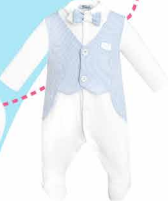
1167.43 Комплект (комбинезон, чепчик)

Производитель оставляет за собой право изменять комплектность и дизайн изделий без ущерба для качества. Издание носит рекламный характер и не является публичной офертой.