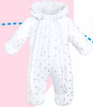
634.20 Комбинезон прогулочный на синтепоне