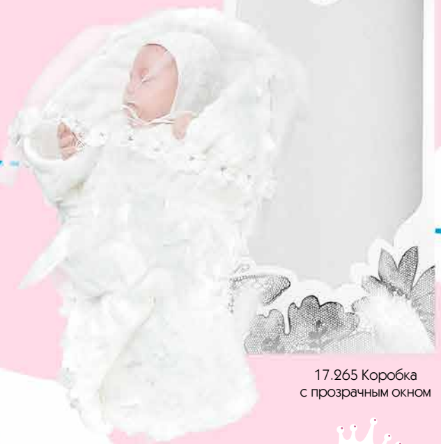
17.265 Коробка с прозрачным окном