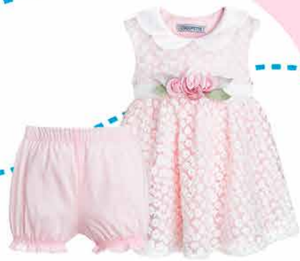
1134.43 Комплект (платье и шортики)