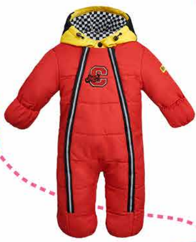
632.20 Комбинезон прогулочный на синтепоне