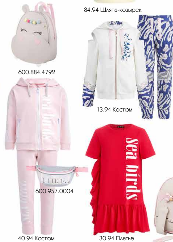
84.94 Шляпа-козырек 600.884.4792 13.94 Костюм 600.957.0004 40.94 Костюм 30.94 Платье 600.960.4792