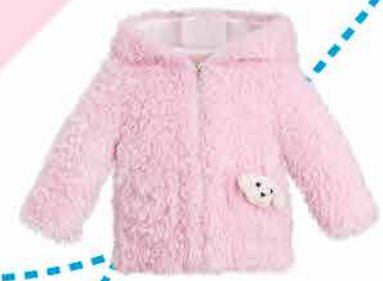
47.92 Курточка из пушистого трикотажа