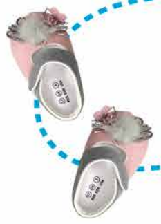
Пинетки в ассортименте