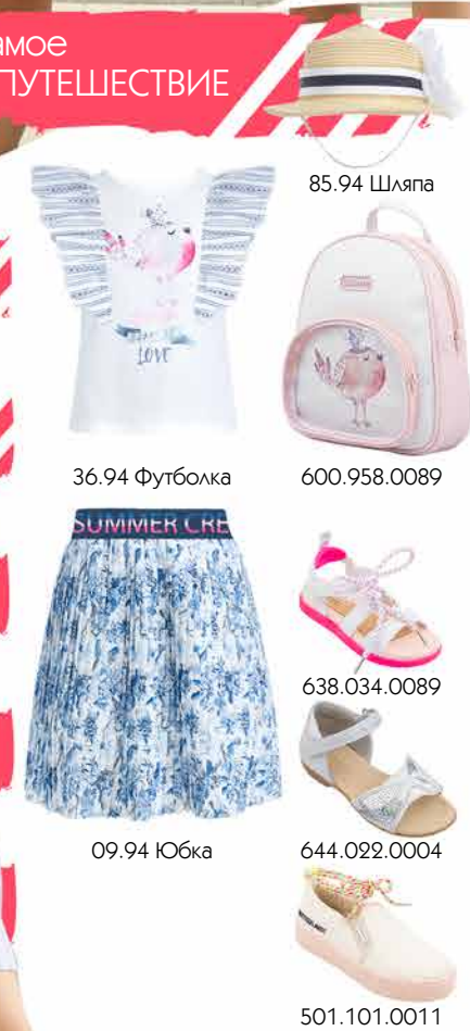
85.94 Шляпа 36.94 Футболка 09.94 Юбка 600.958.0089 638.034.0089 644.022.0004 501.101.0011