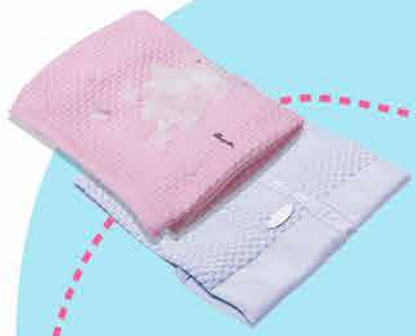
Пледы в ассортименте