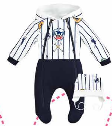
17.95 Комплект (комбинезон, чепчик)