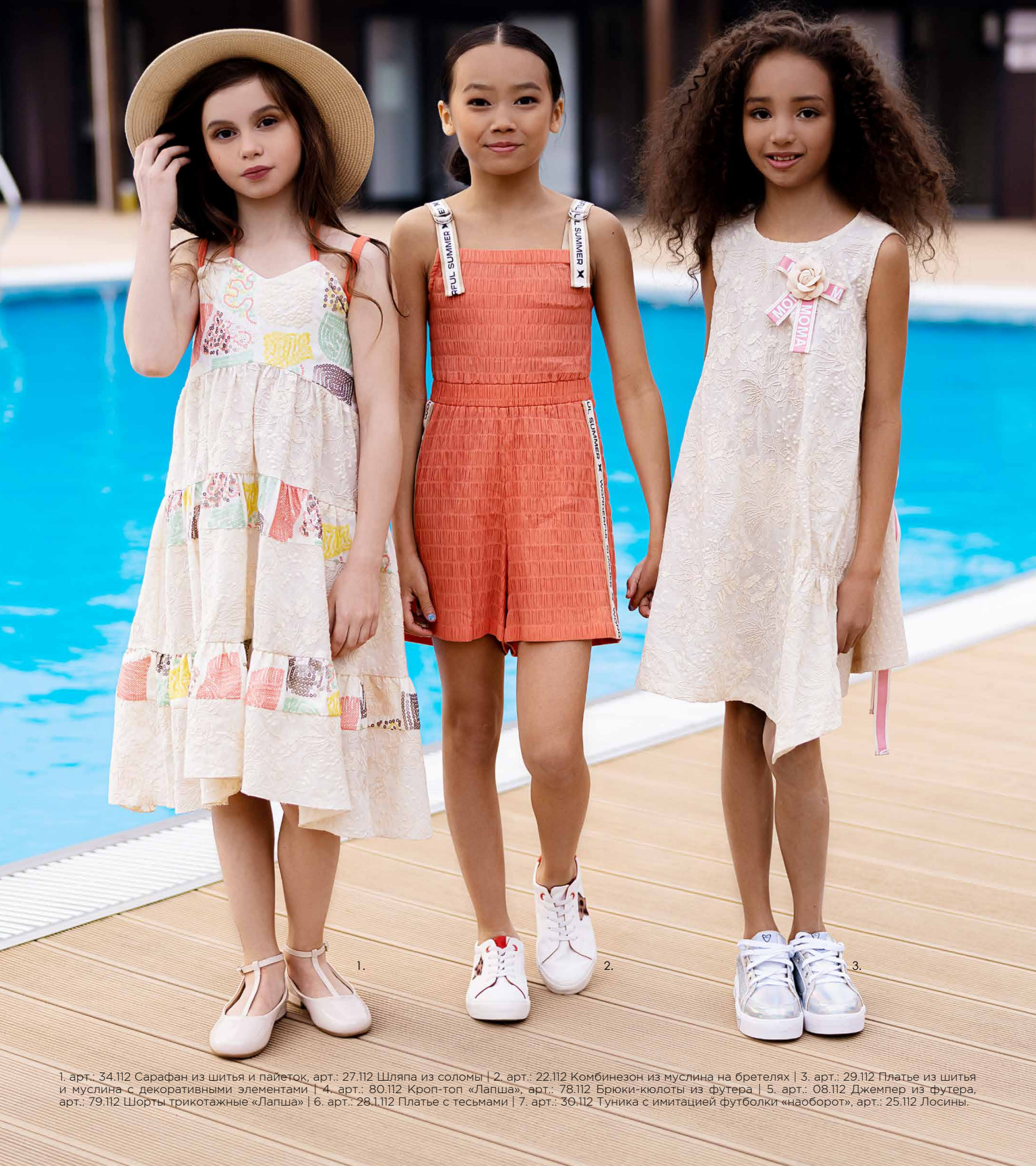
1. арт.: 34.112 Сарафан из шитья и пайеток, арт.: 27.112 Шляпа из соломы | 2. арт.: 22.112 Комбинезон из муслина на бретелях | 3. арт.: 29.112 Платье из шитья и муслина с декоративными элементами | 4. арт.: 80.112 Кроп-топ «Лапша», арт.: 78.112 Брюки-кюлоты из футера | 5. арт.: 08.112 Джемпер из футера, арт.: 79.112 Шорты трикотажные «Лапша» | 6. арт.: 28.112 Платье с тесьмами | 7. арт.: 30.112 Туника с имитацией футболки «наоборот», арт.: 25.112 Лосины.

Совсем скоро наступит жаркое лето! Можно будет наслаждаться солнцем и легким бризом, купаться и играть с друзьями, есть мороженое и пить холодный лимонад. Чтобы превратить обычный летний день в праздник, предлагаем вам устроить вечеринку у бассейна!